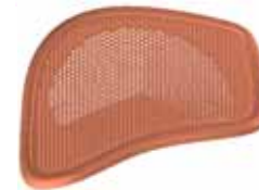
~ 傾斜 45度 ~