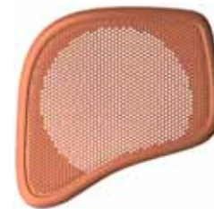
~ 傾斜 0度 ~