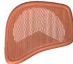
~ 傾斜 25度 ~